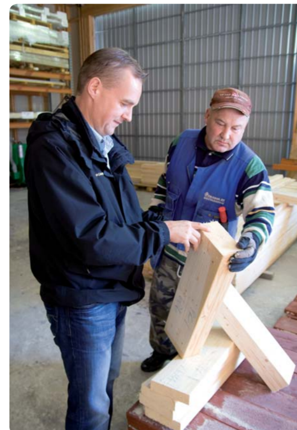
Hyvä henkilökunta on yrityksen kantava voima.

- Kyllä paras tapa rentoutua on liikunta. Juoksun lisäksi koirien kanssa tulee käveltyä usein, muutaman kerran päivässä. Aika kuluu mukavasti mökillä ja kylälahan rakentaja rentoutuu myös rakentamalla. Kaikkeaa pientä nypläämistä löytyy aina.